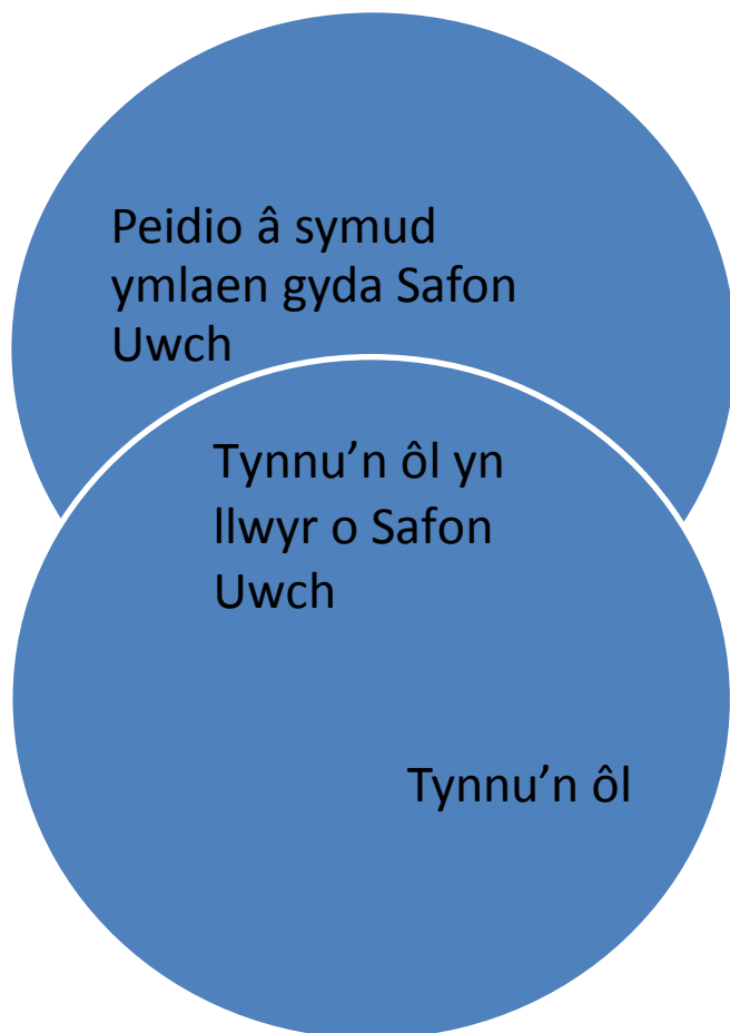
Tabl 1.1: Dosbarthiadau tynnu'n ôl a pheidio â symud ymlaen