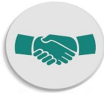
Partneriaethau ac Integreiddio