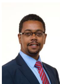
Vaughan Gething AC Y Gweinidog Iechyd a Gwasanaethau Cymdeithasol