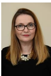
Kirsty Williams AC Y Gweinidog Addysg

Hoffem ddiolch ar goedd i arweinwyr cwnsela awdurdodau lleol, y darparwyr gwasanaethau a'r cydweithwyr eraill a gyfrannodd at y fframwaith hwn, am eu hymroddiad, eu gwaith caled a'u hymrwymiad parhaus i godi'r safonau a sicrhau cysondeb mewn gwasanaethau cwnsela i'n holl blant a phobl ifanc. Rydym hefyd yn ddiolchgar iawn am gyfraniad sylweddol ein cydweithwyr yng Nghymdeithas Cwnsela a Seicotherapi Prydain (BACP) ac am eu cymorth wrth ychwanegu at ei gynnwys a sicrhau ei fod yn addas i'r diben.