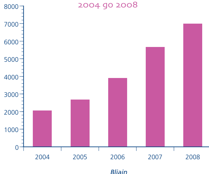
Méadú i Líon na nDaltaí Núíosacha 2004 go 2008